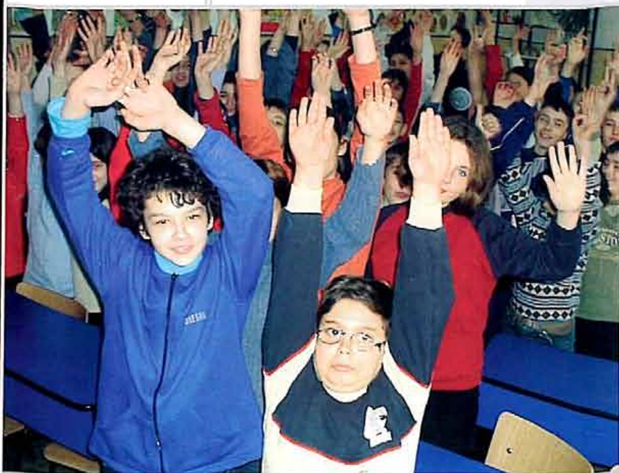
București Copiii din România se alătură campaniei internationale „Hands Up for Girls' Education”

Inițiativele promovate de Centrul de Informare, Documentare și Cercetare privind Drepturile Copilului răspund mai multor tipuri de încălcări ale drepturilor copilului care au cauze comune: lipsa de informare, implicare și angajament. În continuare un mare număr de copii se află în dificultate: copiii afectați de sărăcie, copiii infectați cu HIV/SIDA, copiii discriminați pe criterii etnice sau sociale etc. Deoarece primul pas în rezolvarea problemelor constă în determinarea extinderii acestora, a cauzelor și implicațiilor fenomenelor luate în discuție, considerăm că monitorizarea drepturilor copilului este esențială. Datele statistice, cercetările calitative și cantitative sunt baza elaborării programelor și strategiilor pentru toate organismele implicate, fie guvernamentale sau neguvernamentale. Drepturile copilului constituie o problemă de interes general și necesită implicare generală. De aceea, campaniile de creștere a nivelului de conștientizare asupra problematicii copilului sunt la fel de importante ca și campaniile adresate specialiștilor.