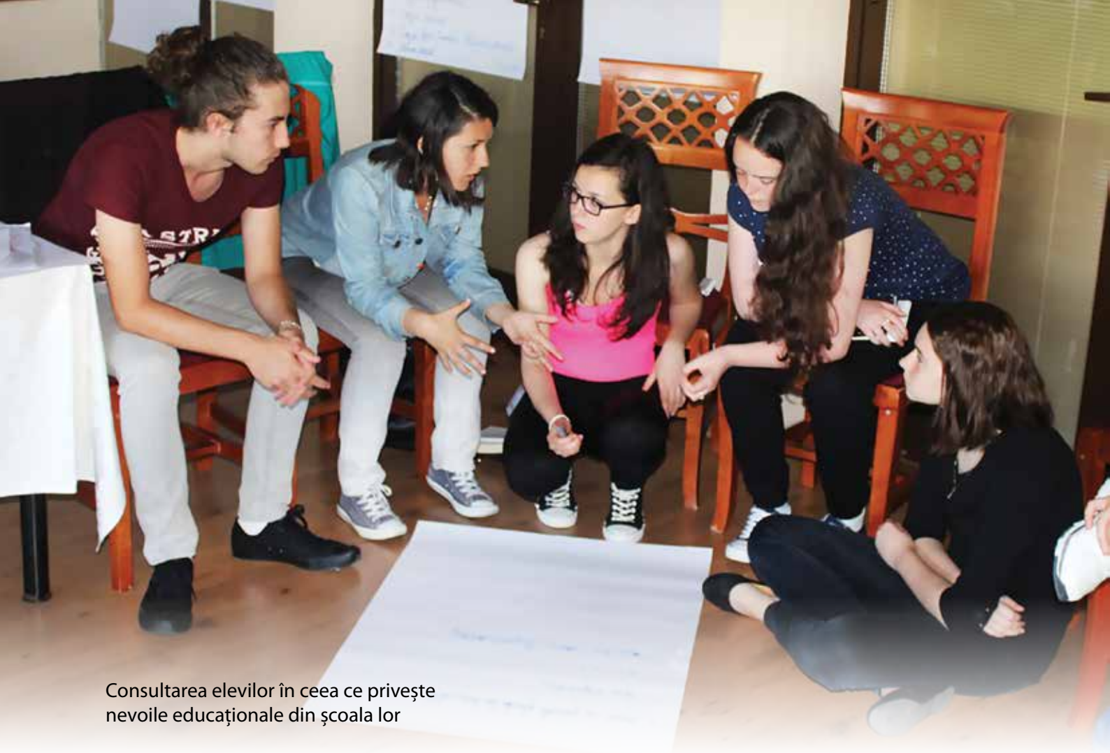
Consultarea elevilor în ce privește nevoile educaționale din școala lor