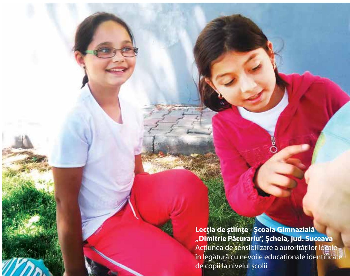
Lecția de științe - Școala Gimnazială „Dimitrie Păcurariu”, Șcheia, jud. Suceava Acțiunea de sensibilizare a autorităților locale în legătură cu nevoile educaționale identificate de copii la nivelul școlii