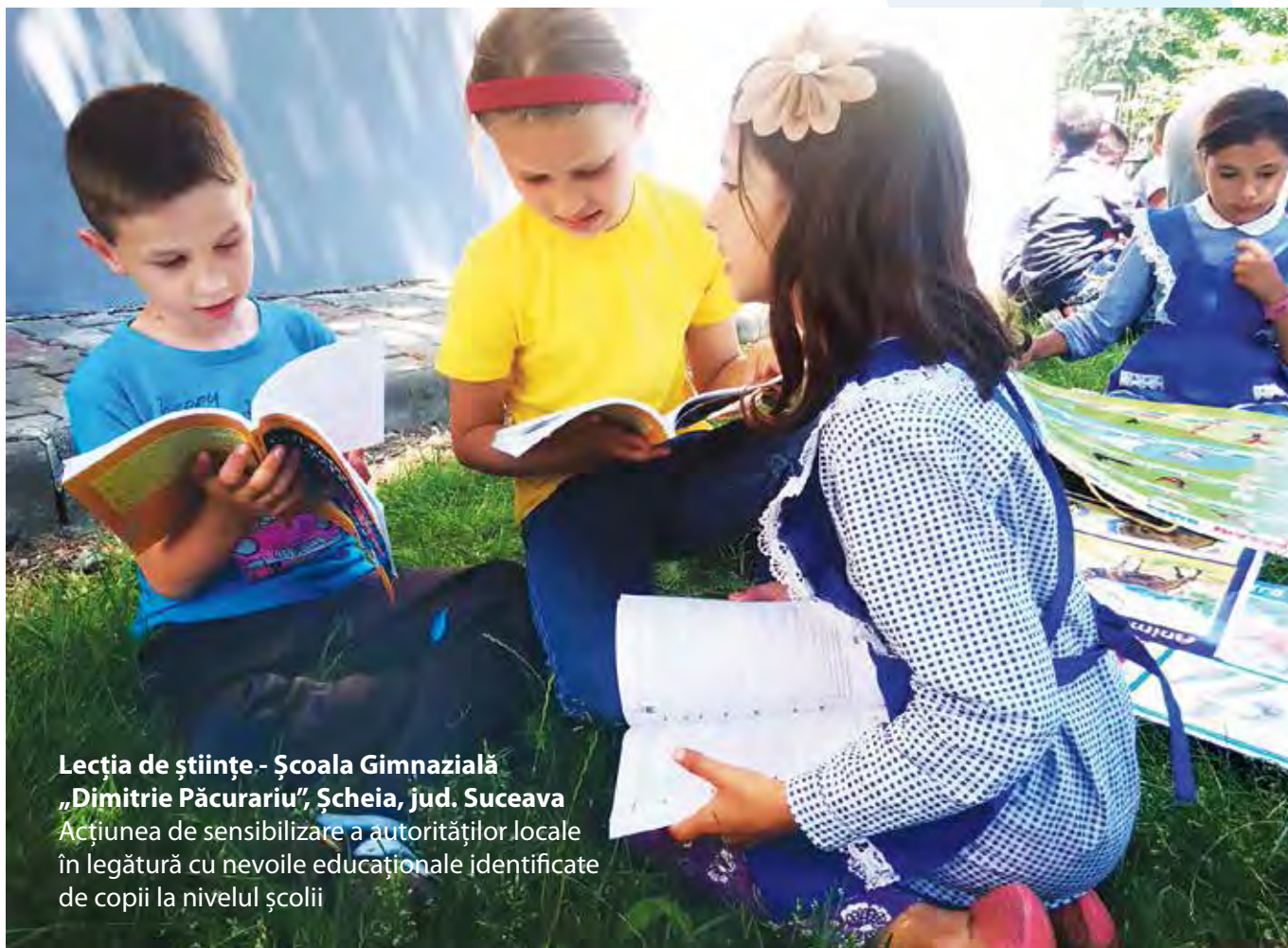
Lecția de științe - Școala Gimnazială „Dimitrie Păcurariu”, Șcheia, jud. Suceava Acțiunea de sensibilizare a autorităților locale în legătură cu nevoile educaționale identificate de copii la nivelul școlii