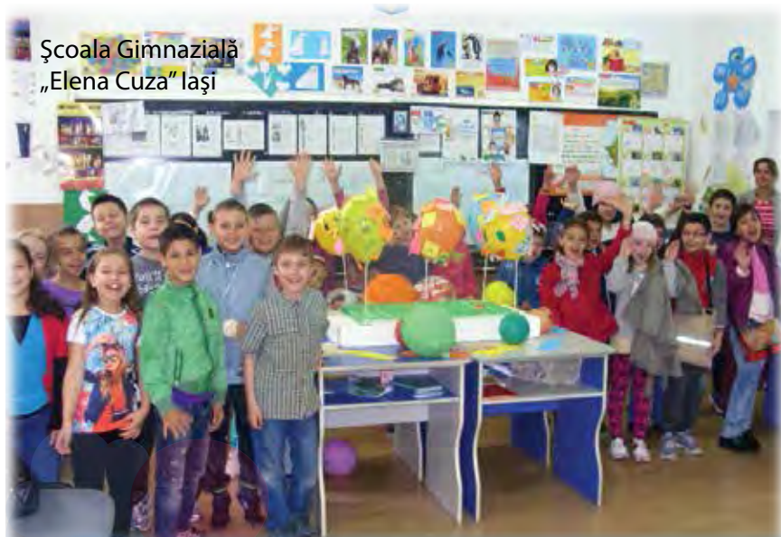
Școala Gimnazială „Elena Cuza” Iași