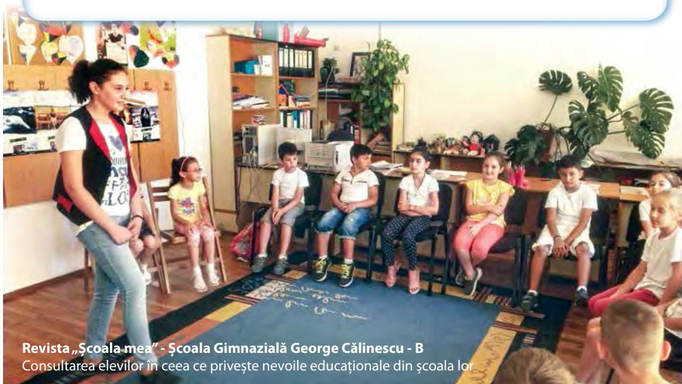
Revista „Școala mea” - Școala Gimnazială George Călinescu - B Consultarea elevilor în ceea ce privește nevoile educaționale din școala lor