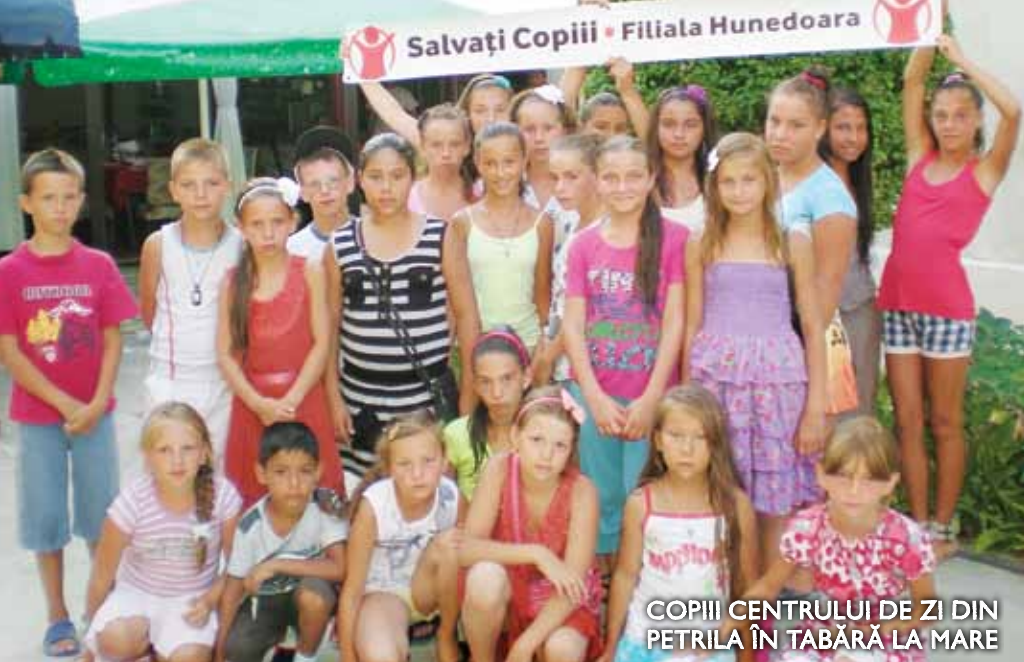
COPIII CENTRULUI DE ZI DIN PETRILA ÎN TABĂRĂ LA MARE

Lansat în urmă cu trei ani de către Școala Gimnazială nr. 2, în parteneriat cu filiala Caraș-Severin, proiectul „ Bucuria de a dăru ” a continuat în 2013 prin oferirea de cadouri pentru 380 de copii.