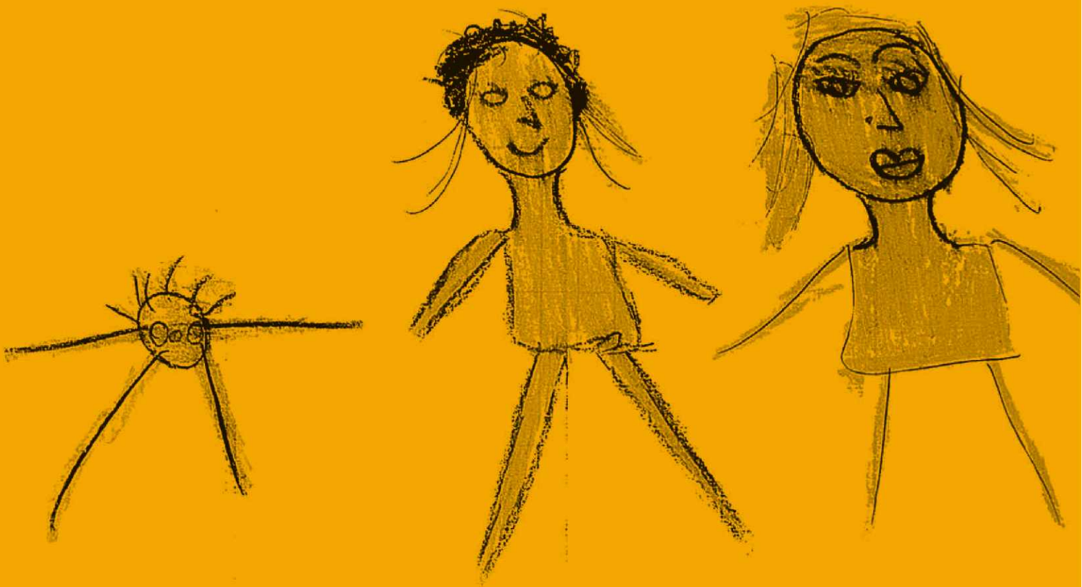
Valbona Zenollari, 14 ani