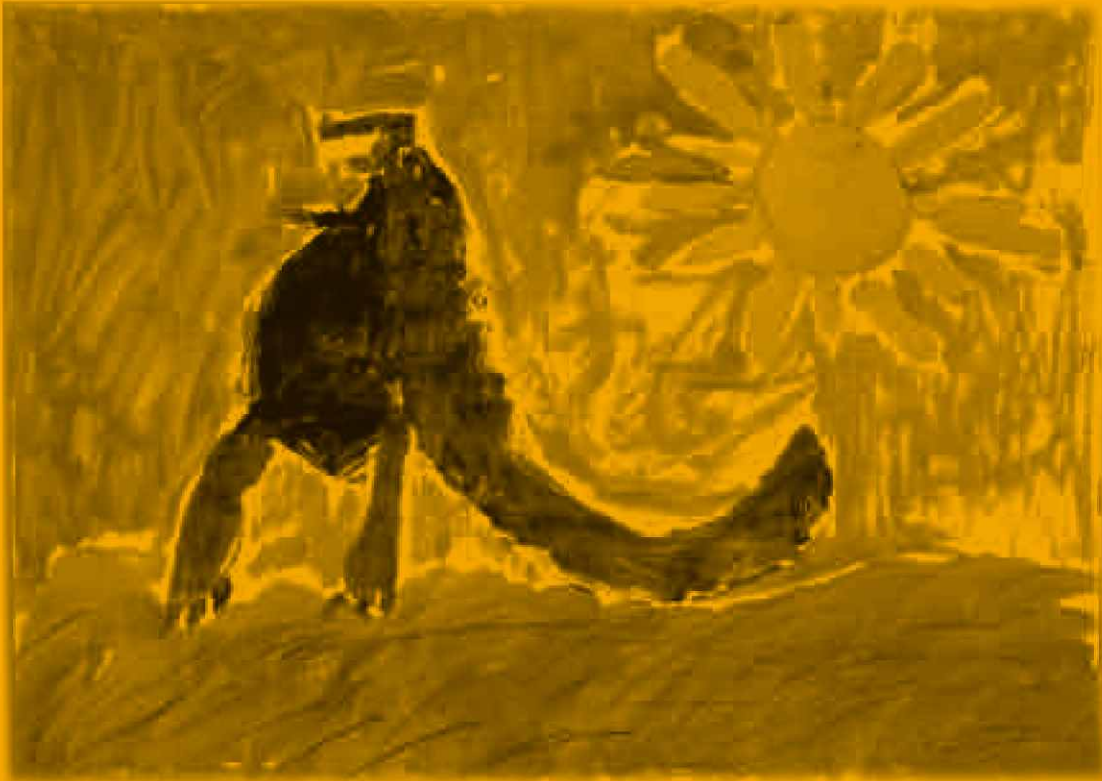
Ahmet Alushi, 14 ani